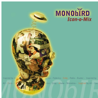
MONObIRD / Icon-o-Mix (duoproject, SonoFab 2002)

'Een echt lexicon van stijlen uit de voorbije kwarteeuw: eclectisch, verhalend, charmant en af en toe slechts licht verkleurd door de jaren'. (Le Vif, 25/5/2005)