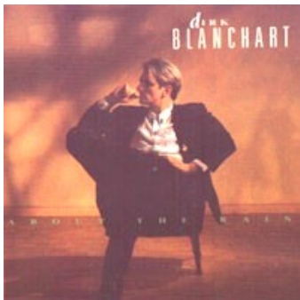
ABOUT THE RAIN (BMG Ariola 1989)

'...een van de betere langspelers die we de laatste tijd onder de lazer kregen geschoven'. (De Morgen)