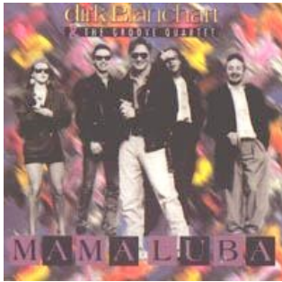
MAMA LUBA (BMG Ariola 1990)

'...het nieuwe album toont een onmiskenbare artistieke rijpheid'. (La Dernière Heure)