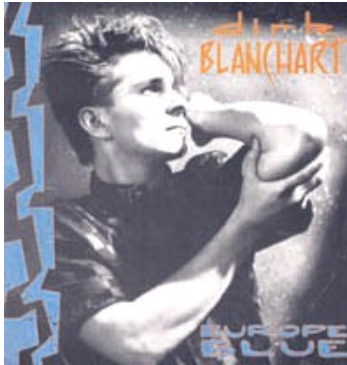
EUROPE BLUE (Statik UK 1985)

'...getuigt van liefde voor het vak en straalt een stevig bluesy sfeertje uit'. (Het Belang van Limburg, Stijn Meuris)