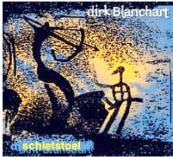
SCHIETSTOEL (Oorwoud 1998)

'Eén van zijn beste platen in 15 jaar solocarrière'. (De Standaard)