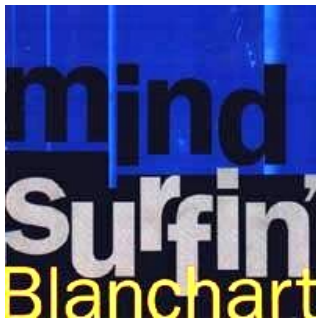
MINDSURFIN' (EMI 1995)

'... zijn platen klinken vandaag nog altijd even tijdloos als toen ze voor het eerst werden uitgebracht'. (De Morgen)